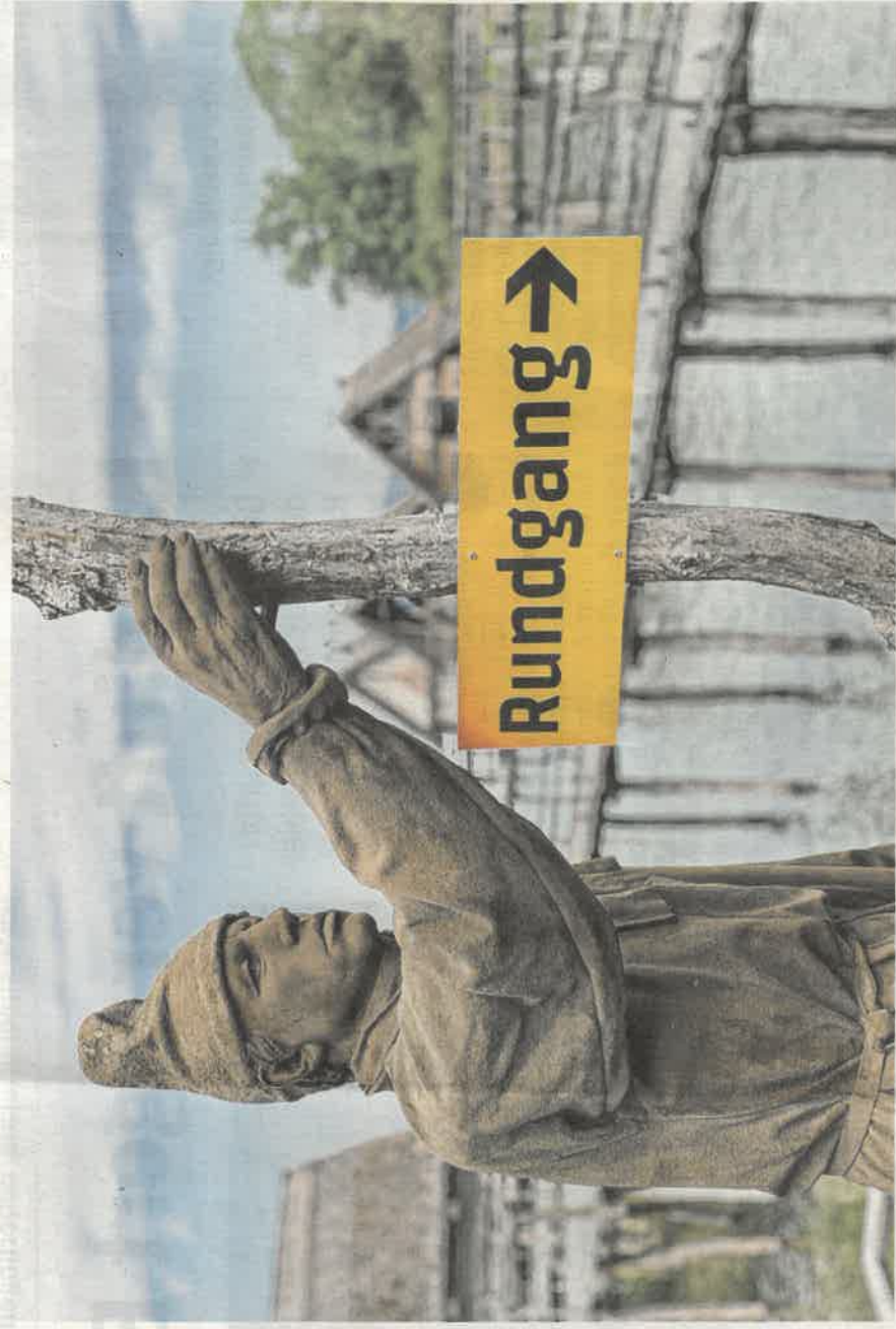
Eigentlich viel Platz an der frischen Luft: Das Freilichtmuseum Unteruhldingen. Doch im Gegensatz zu einem Besuch im Zoo bleibt das Museum trotz seines erprobten Hygienekonzeptes ab einer Inzidenz von 100 geschlossen.